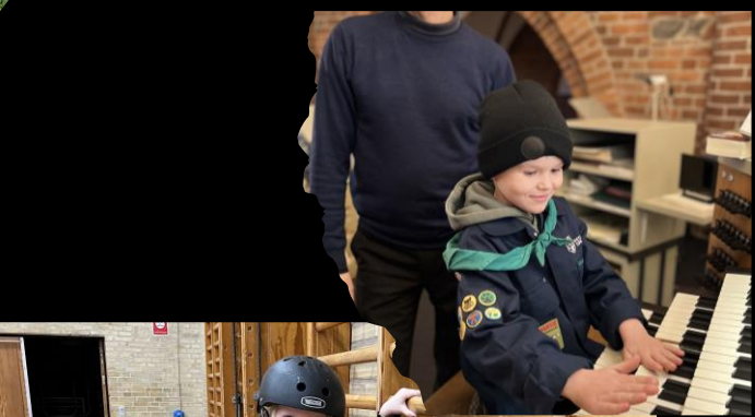
Møder væk fra Bøgevangsgade