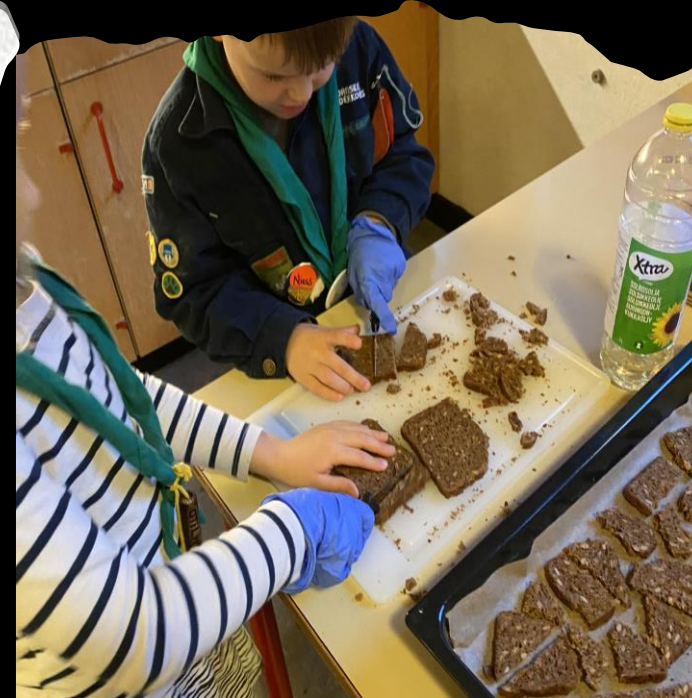
Bag for en sag